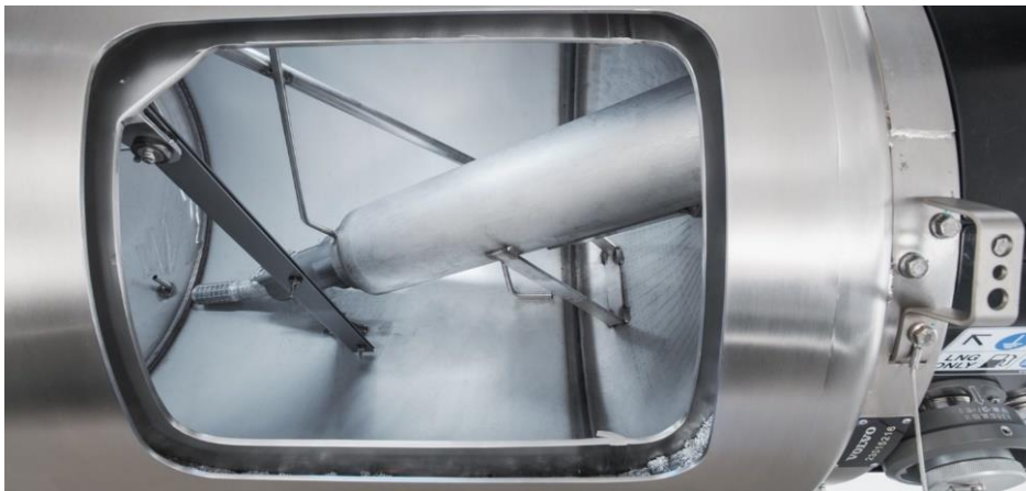
Schnittdarstellung eines LNG-Tanks