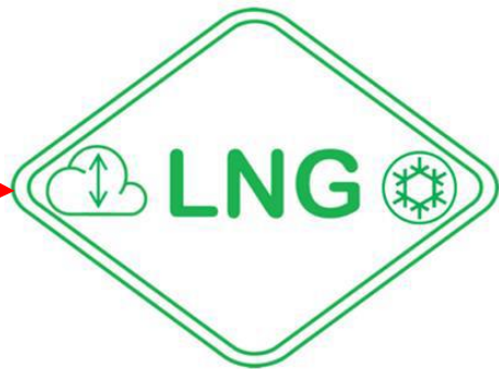
Kennzeichnung LNG-Tank