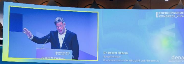
Dr. Robert Habeck Bundesminister Bundesministerium für Wirtschaft und Klimaschutz

SEIEN SIE DABEI: WERDEN SIE PARTNER BEIM DENA ENERGIEWENDE- KONGRESS!