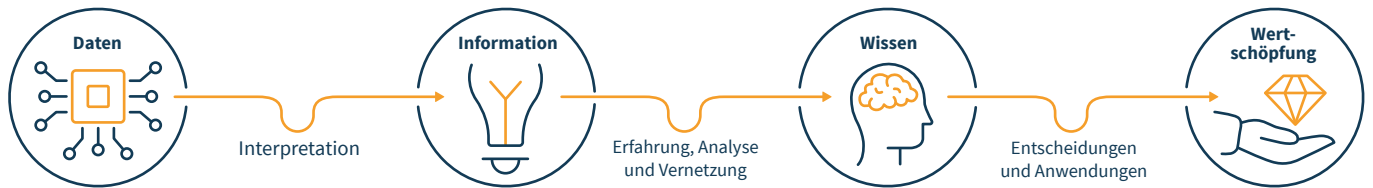
Abbildung 1: Von Daten und Informationen, hin zu Wissen und Wertschöpfung