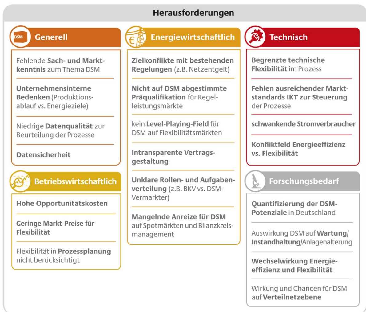
Abbildung 2: Übersicht Herausforderungen DSM.

Die Herausforderungen treten in unterschiedlichen Gebieten auf. Das folgende Kapitel beschreibt die Bedeutung und die Herausforderungen der einzelnen Handlungsfelder in Bezug auf DSM. Basierend auf den Projekterfahrungen aus dem Pilotprojekt DSM Bayern und in enger Abstimmung mit dem Projektbeirat hat die dena für jedes Handlungsfeld Handlungsempfehlungen abgeleitet, um die vorhandenen Herausforderungen bei der Erschließung und Vermarktung von DSM-Potenzialen zu meistern.