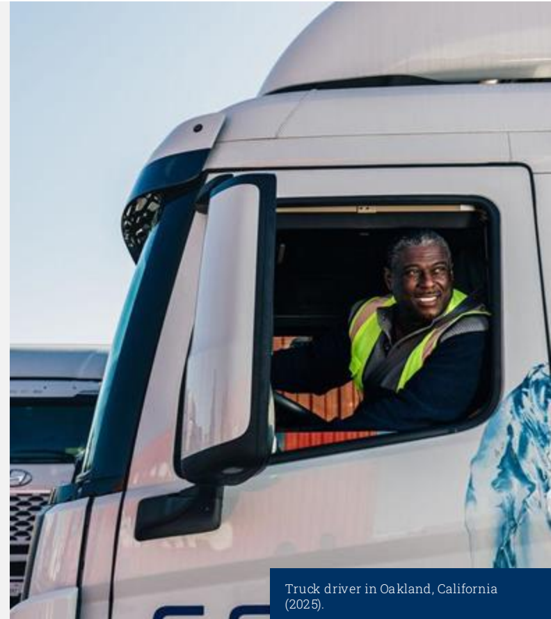
Truck driver in Oakland, California (2025).