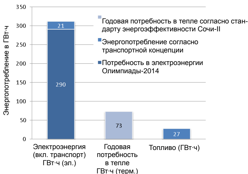
Рис. 1. Сценарий потребности в энергии зимней Олимпиады-2014 при реализации концепций dena

Ниже представлен итоговый сценарий потребности в энергии за время проведения Олимпийских игр, а также потребность в тепле в 2014 году: